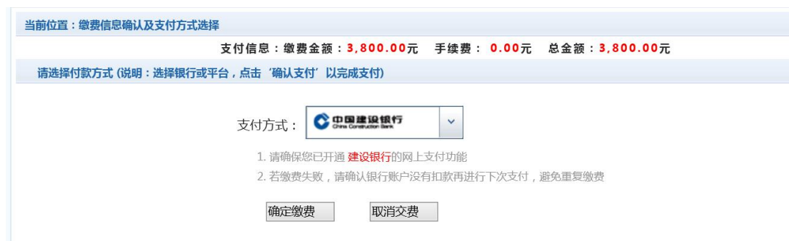
图 3.4-10 建行支付选择

如图 3.4-9 所示，确定支付金额无误后，选择“中国建设银行”点击“确定缴费”，进入如图 3.4-10 所示建行支付界面。