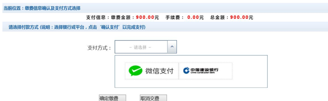
图 3.4-4 缴费方式选择