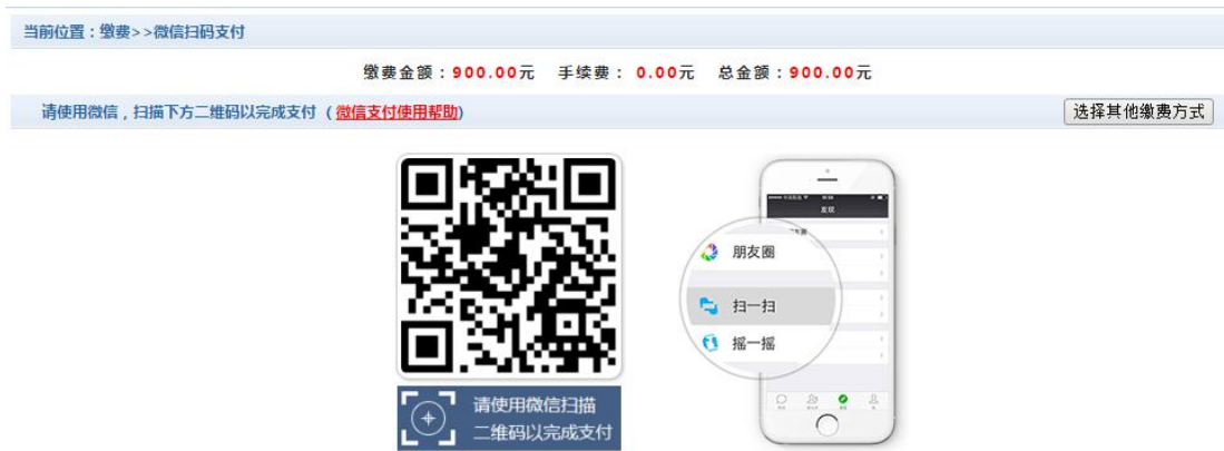
图 3.4-6 微信二维码支付界面

微信支付, 如图 3.4-7 所示, 手机打开微信, 点击“发现”, 点击“扫一扫”, 扫描图 3.4-6 所示的二维码, 进入微信支付界面。