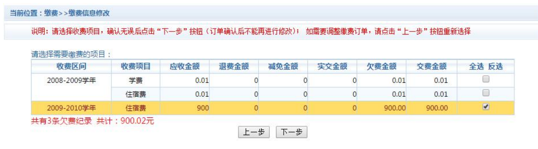
图 3.4-2 缴费项目选择