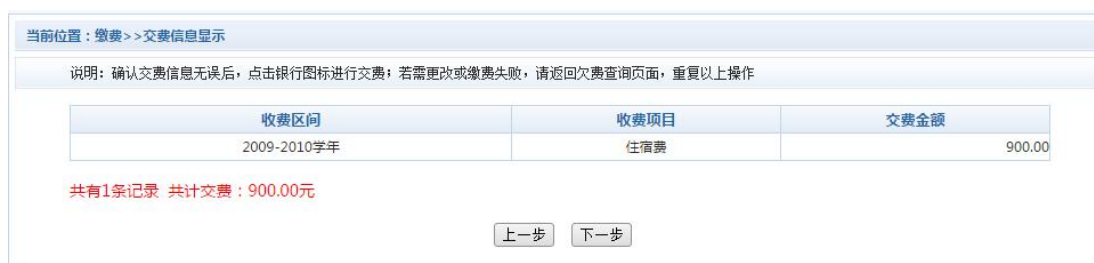
图 3.4-3 缴费方式选择