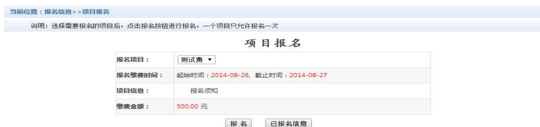
图 3.8-1 项目报名

已注册用户（包括在校生、其他使用过平台缴费的人员）可以登录支付平台，点击导航栏“报名信息”界面，选择报名项目，点击“报名”按钮进行报名。如图 3.8-1 所示