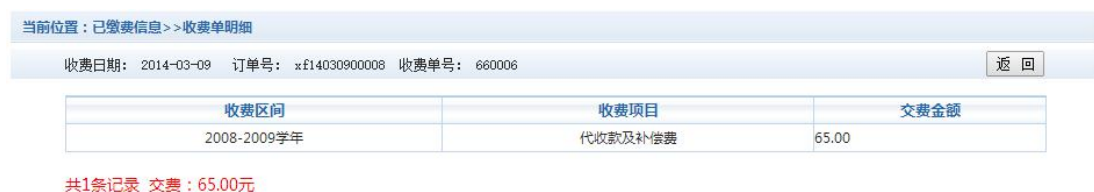
图 3.7.2 已缴费明细