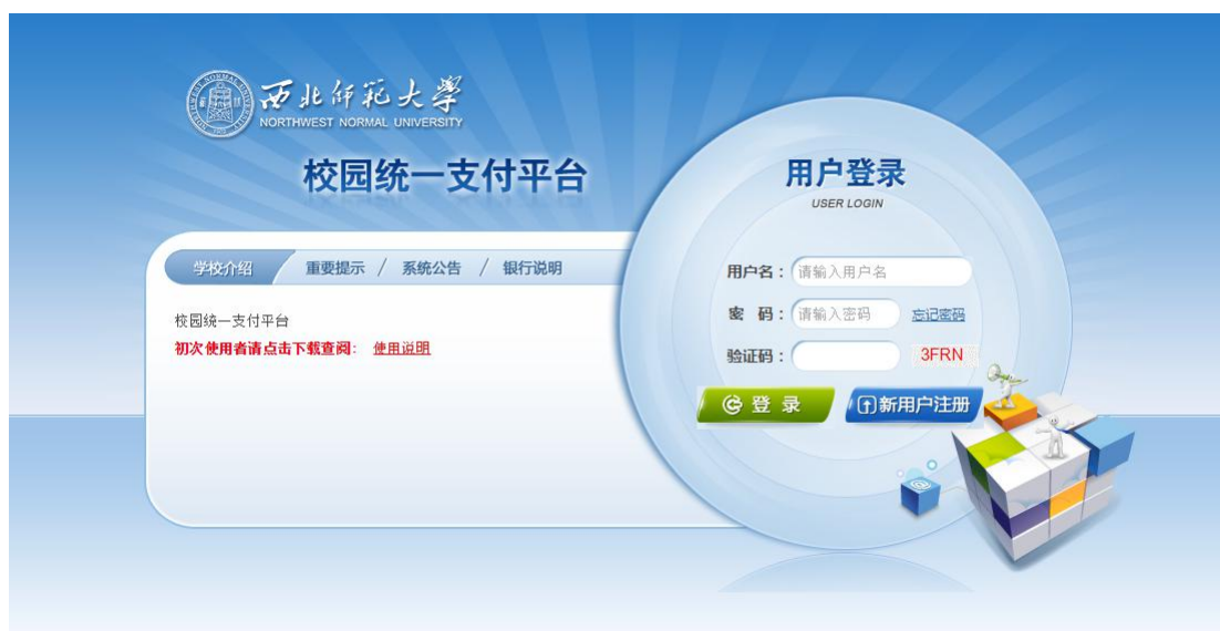
图 3.1-1 统一支付平台登陆界面

在浏览器地址栏输入 http://202.201.50.8/ ，如图 3.1-1 所示。登陆之后显示个人欠费信息，如图 3.1-2 所示。