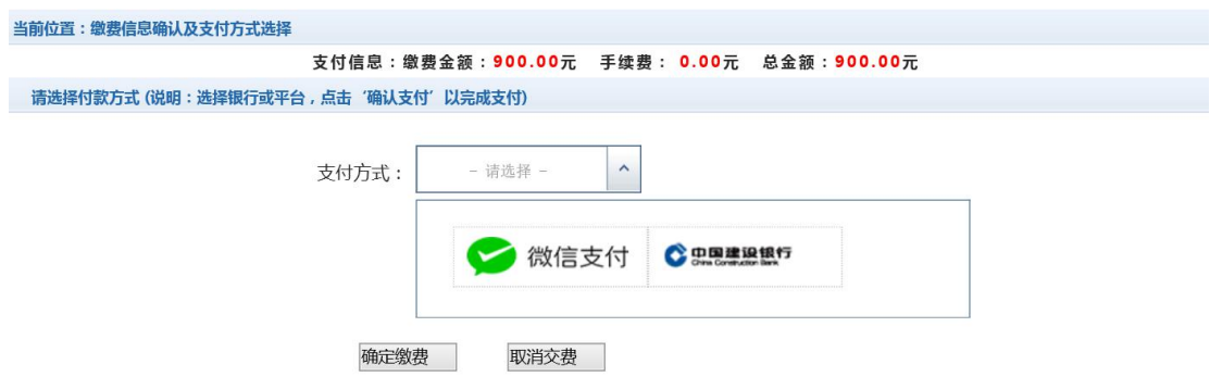
图 3.5-3 缴费信息及缴费方式选择