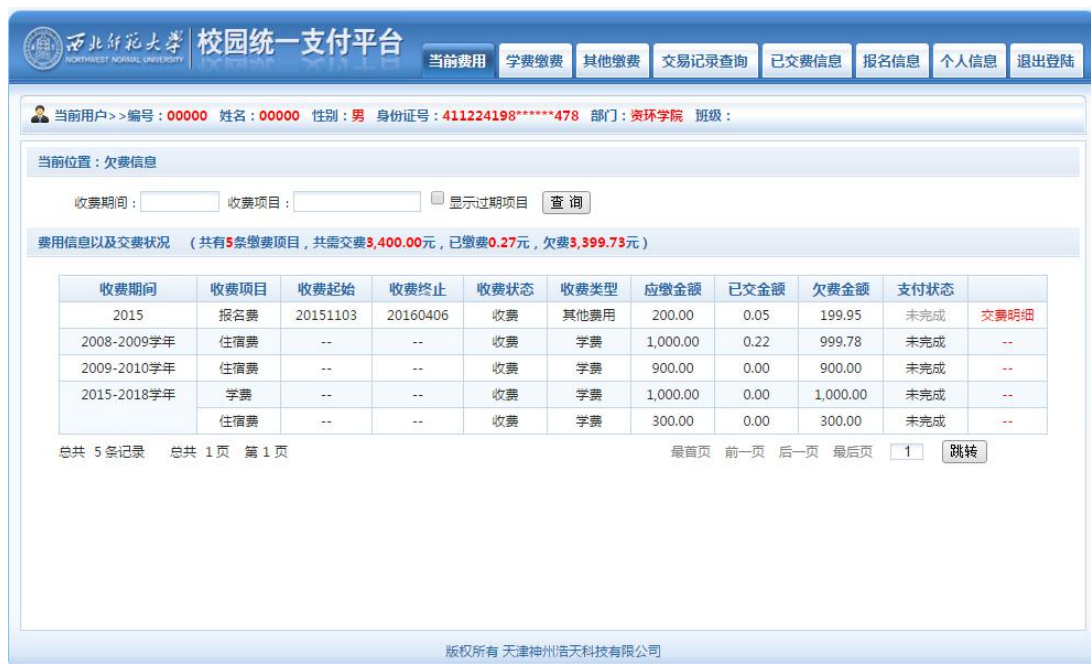
图 3.1-2 统一支付平台登陆后页面