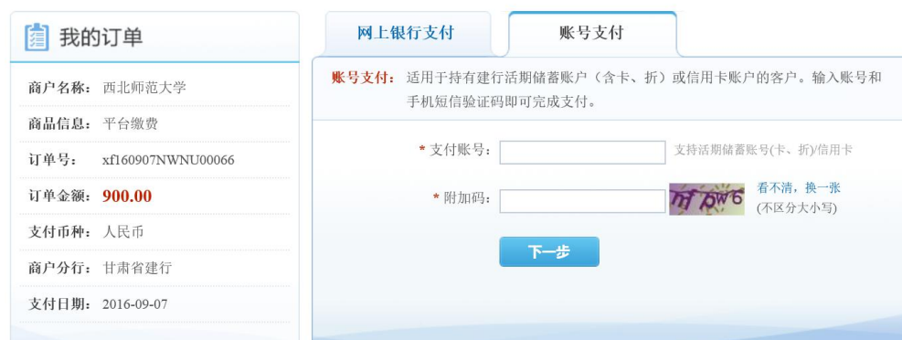
图 3.4-12 建行账号支付

如果持有建设银行储蓄卡或信用卡，请点击“中国建设银行”，进入如图 3.4-12 所示建行账号支付界面。