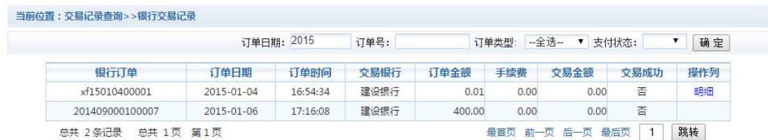
图 3.6-1 交易记录查询

点击导航栏的“交易记录查询”按钮，可以查询具体的银行交易记录。如图 3.6-1 所示。