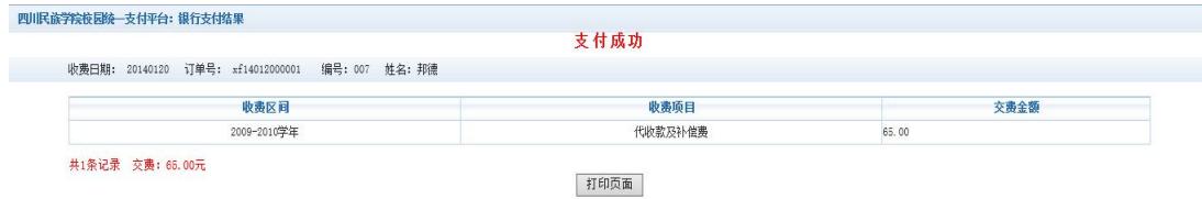
图 3.4-8 支付成功