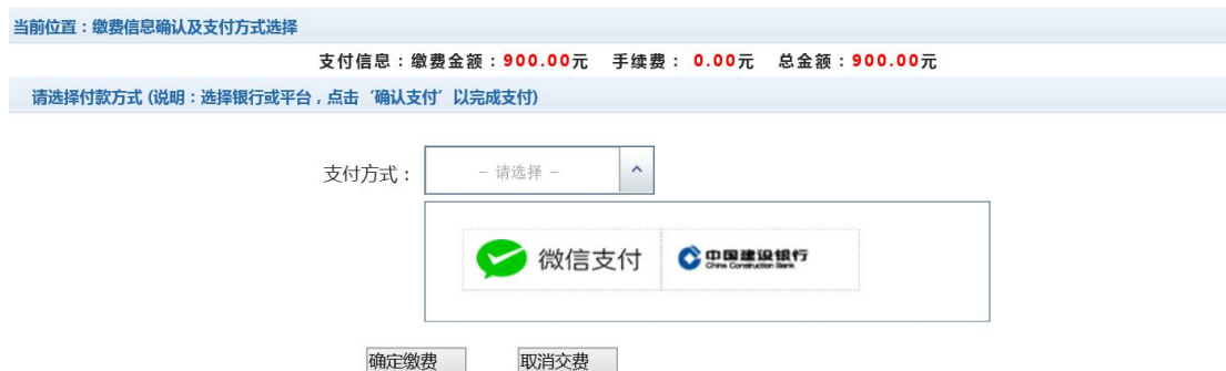
图 3.4-9 缴费方式选择

如图 3.4-9 所示，确定支付金额无误后，选择“中国建设银行”点击“确定缴费”，进入如图 3.4-10 所示建行支付界面。