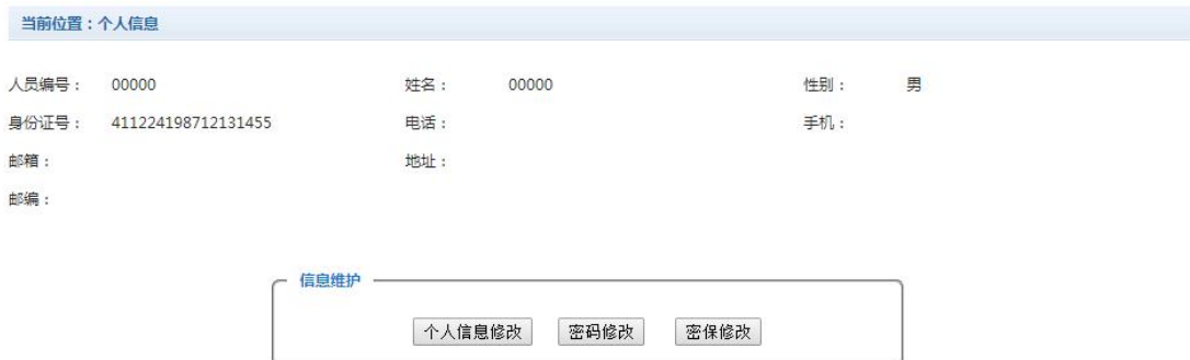
图 3.2-1 个人信息维护界面