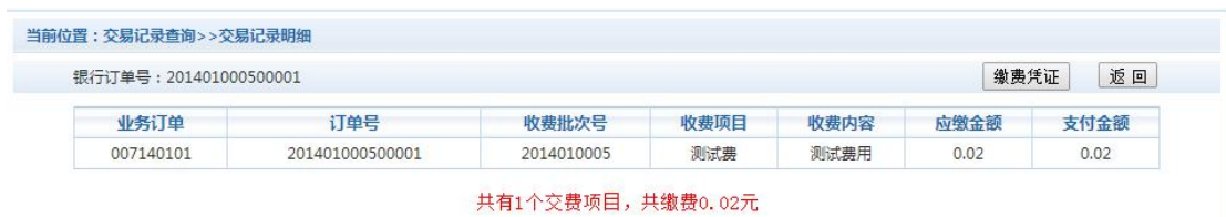
图 3.6-2 交易记录明细

若是其他缴费的订单，可以点击缴费凭证，查看和打印缴费凭证。如图 3.6-3 所示