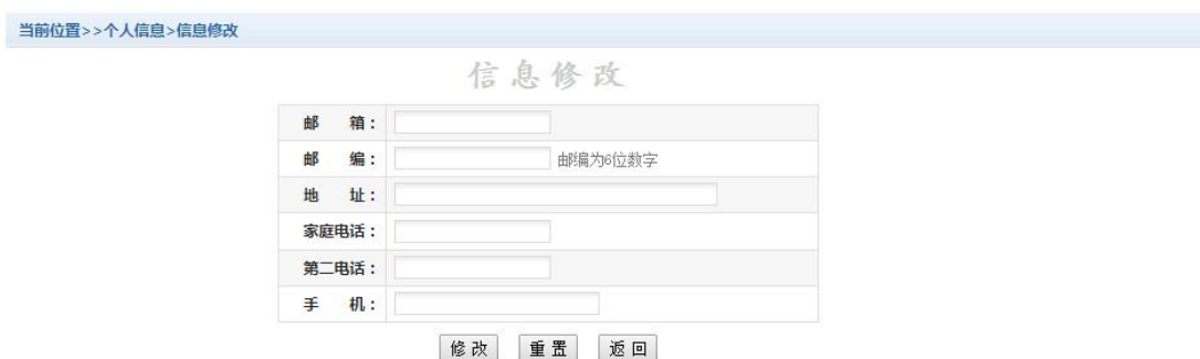
图 3.2.1-1 个人信息修改

点击个人信息界面的个人信息修改，显示 3.2.1-1 所示的个人信息维护界面。在相应的输入框，输入需要修改的个人信息，点击“修改按钮”完成个人信息维护。未保存前，点击“重置”按钮，还原个人信息。