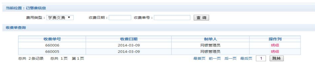
图 3.7-1 已缴费信息显示